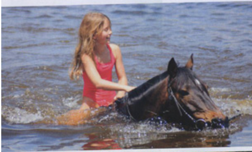
En todo momento irás acompañado de expertos guías.